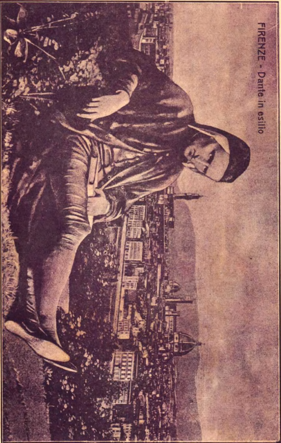
FIRENZE - Dante in esilio