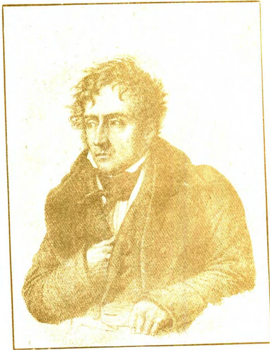
像良布士夏 François René Vicomte de Chateaubriand (1768-1848)